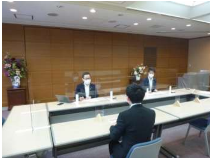
※個別相談会の様子(奥側2名が信金キャピタル(株)東海事務所の担当者)

当金庫は、今回の相談会の開催を通して、事業承継・M&Aに関する潜在的なニーズの掘り起しに努めるとともに、「どこへ相談すれば良いか」悩まれている事業者の不安に応えるべく取り組んでまいりました。今後も、当地域の事業承継・M&A支援活動に主体的に取り組み、地域の事業者の成長・発展をお手伝いし、地域経済の活性化に貢献していく所存です。