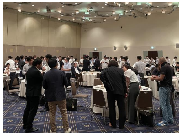
■会員同士が交流を深める懇親会