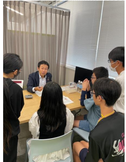
左から「プログラムスタート」、「はじめてのメンバー同士での会社づくり」、「とよしんへの融資相談」