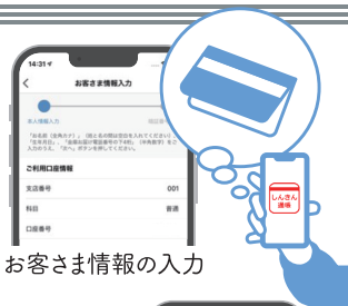
お客さま情報の入力